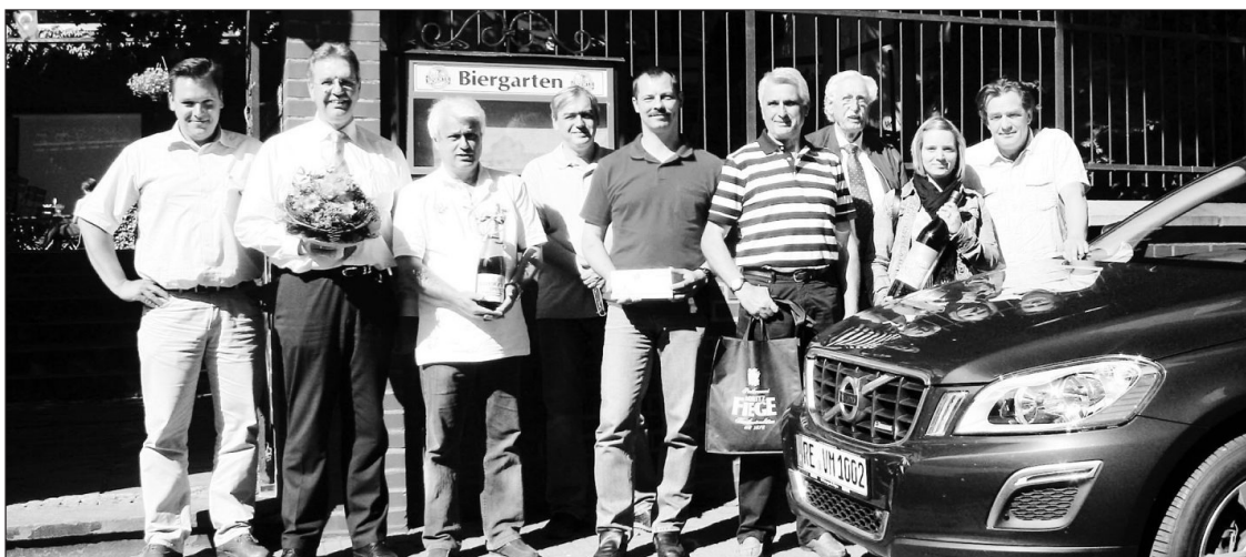
Sponsoren und Gewinner strahlen bei der Übergabe der Gewinne mit der Sonne um die Wette.

Diese Höhe hatte – da sie eigentlich nicht vorgesehen war – niemand auf dem Tippzettel des Gewinnspiels „Erraten Sie die Siegeshöhe“, und so zog Spiegelburg nach dem Springen die Gewinner aus dem 5,73-m-„Töpfchen“. Die Sponsoren des Springens hatten zahlreiche Preise ausgeteilt. In der Hausbrauerei Boente in Recklinghausen wurden sie gestern übergeben.